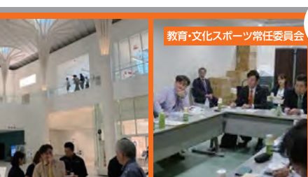
11/9 沖縄県立博物館・美術館 全国でもめずらしい博物館と美術館の複合施設の調査。