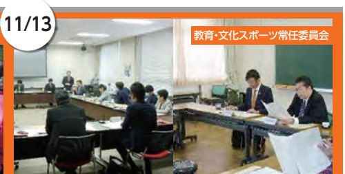
11/13 立命館守山中学校・高等学校(守山市)/水口東中学校・高等学校(甲賀市) 中高一貫教育について、これまでの取り組みと現状について把握するため調査。