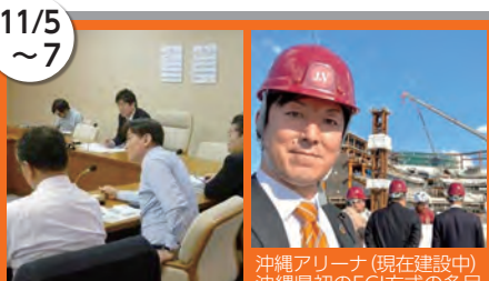
11/5~7 沖縄アリーナ(現在建設中)沖縄県初のECI方式の多目的アリーナを活用したスポーツによる地域の活性化について調査。